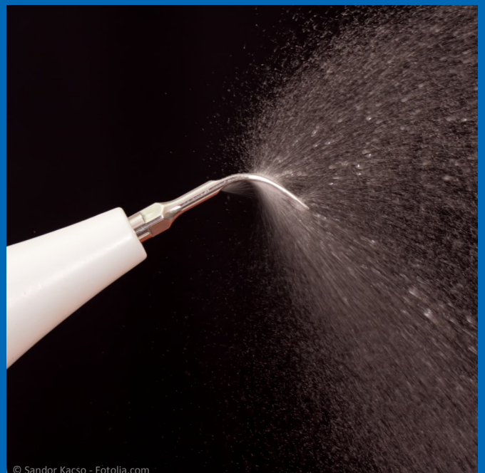
Wassergekühlte Ultraschallspitze für die Entfernung harter Beläge von den Wurzeloberflächen und zur Säuberung der Zahnfleischtaschen